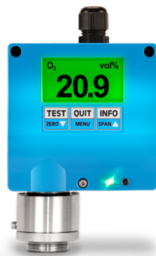
Version analogique de l'EC22 O avec une entrée de câble et un affichage

La détection rapide des insuffisances d'oxygène est rendue plus difficile lorsqu'un gaz très léger comme l'hélium s'échappe, puisque sa densité de gaz n'est que de 0,14 (air = 1). L'EC22 O avec capteur de pression partielle et affichage a été développé spécifiquement pour la surveillance de l'oxygène dans les environnements avec des gaz de faible poids moléculaire.