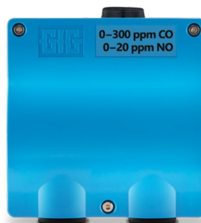
Transmetteur 0220.DS pour la surveillance des gaz d'échappement dans les parkings souterrains