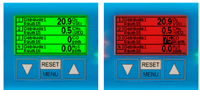
Messwertübersicht im Normal- bzw. im Alarmzustand

Die aktuellen Messwerte aller Transmitter werden kontinuierlich im 2,2"-LC-Display angezeigt. Den Betriebsstatus zeigen die Status-LEDs an. Im Normalbetrieb leuchtet nur die grüne LED. Eine gelbe LED weist auf Fehlfunktionen oder Servicearbeiten hin. Im Falle eines Alarms wechselt die Hintergrundfarbe des Displays von Grün zu Rot und nur noch die Messwerte der Messstellen, an denen Grenzwerte über- oder unterschritten wurden, werden dargestellt. Rote LEDs weisen auf die Alarmstufe hin. Zusätzlich ertönt ein akustisches Warnsignal.