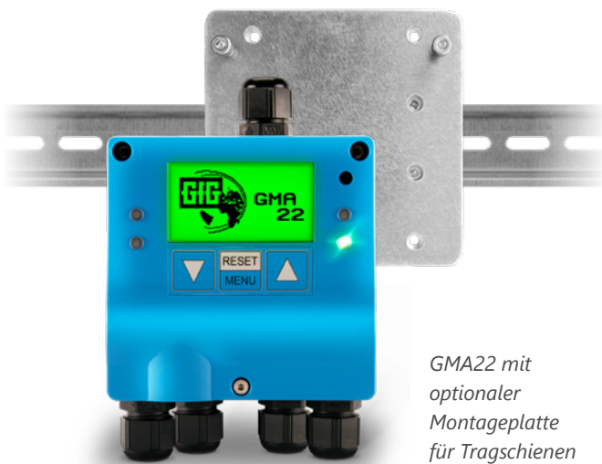
GMA22 mit optionaler Montageplatte für Tragschienen

Noch mehr Flexibilität ergibt sich durch die Option, über die digitale RS485-Schnittstelle nicht nur die Transmitter, sondern auch bis zu 4 zusätzliche Relaismodule vom Typ GMA200-RT bzw. GMA200-RTD anzusprechen.